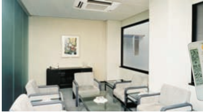
FFQ 25, 35, 50, 60 B típusú beltéri egység