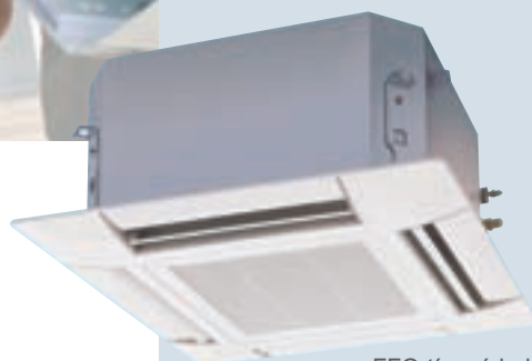
FFQ típusú beltéri egység