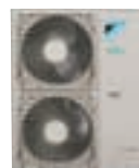
RZQS 125, 140 C