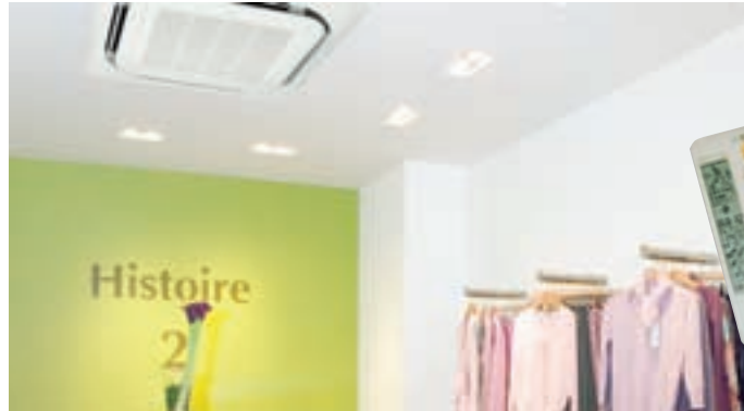
FCQ 35, 50, 60 C típusú beltéri egység