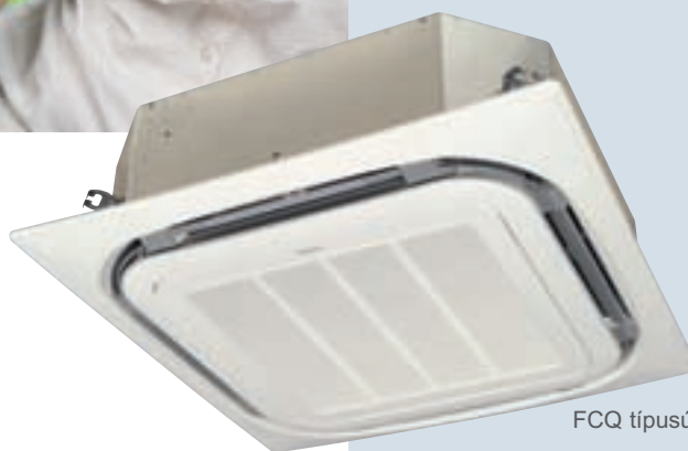
FCQ típusú beltéri egység